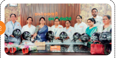
महापौर ने नर्सिंग स्टाफ को हेल्मेट भेंट कर दिया सुरक्षा का संदेश